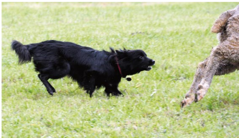
Oben: Caprice du Bonheur de l'Amie à Face Rase im Besitz von Ursula Hauffe. Unten: Céline des Champs des Alouettes.

Es folgen Fotos, die den Ausdruck des Bergers in der Hüteaktion einfangen.