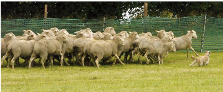
B5 = Ansatz zum Stoppen der Herde: Coco des Champs des Alouettes.