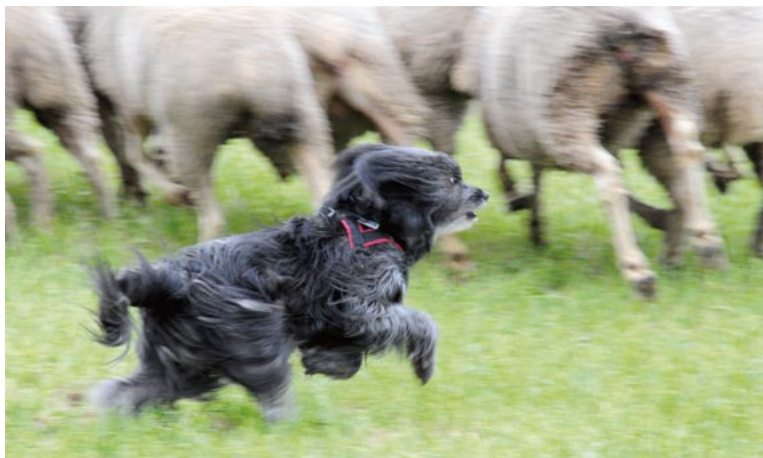
Oben: Harkonnen de la Finaud Gardienne. Unten: Helena vom Wunderhorn.