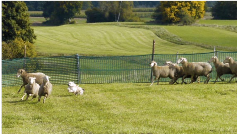
B9 = Zurückholen verirrter oder separierter Schafe zur Herde. Je nach „Gelehrigkeit“ des vereinzelt Schafs verringert (oben Céline des Champs des Alouettes (leider nicht vollendete Aktion); Mitte, unten & rechts oben: Luise M. vom Wunderhorn) oder vergrößert der Berger seinen Abstand zum Ausreißer (rechts Mitte: Bahja du Lac de Faoug leider auf Zuruf).