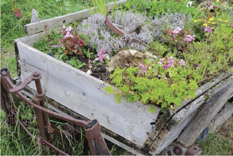
Blumen, Sonnenschein und Schatten der Erde am 26. September 2010 in Pfronstetten auf der Schäferei Fauser.