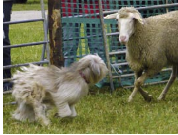
Guyn-Yin von Sashi Eda: „Huch, Du bist ja fast so fauve wie ich!“