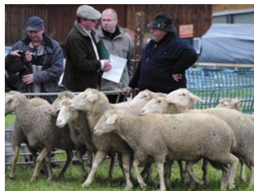
Der Richter sucht Rat beim Spezialisten.