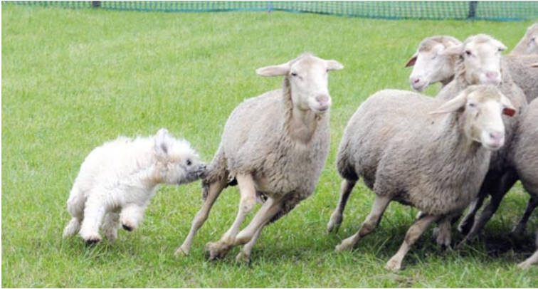
B6 = Vollendeter Griff: Fada du Lac de Faoug. Unten: B7 = Umkreisen der Herde: Bahia du Lac de Faoug (leider nicht vollendet; das Foto suggeriert aber die Aktion) - beide im Besitz ihrer Züchter Sabina & Roland Aebi.