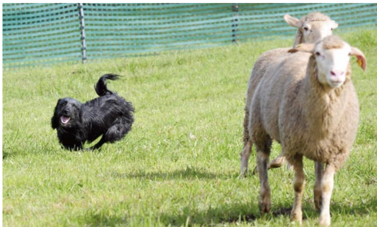
Oben: Xero du Petit Filou. Unten: ??? Bitte melde Dich!