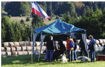
Das „Hütetest-Büro“ auf der Schwäbischen Alb am Sonntag: Sonnig und trocken... Liegt es auch an der Fahne?

In Schwaben ist der Samstag der Schafttag, dann wird alles aufgearbeitet, was die Woche über liegen bleibt, und das ist meist das Wesentliche. Und das Auf- und Abarbeiten geschieht offensichtlich so intensiv, dass der Samstag der einzige Werktag ist, der zum Schafttag befördert wurde. Da dem in Schwaben so ist, konnte nur der Sonntag der Schafttag sein, und so konnte der CBP-Hüteveranlagungstest nur am Sonntag durchgeführt werden – und das war gut so, denn diesem Sonntag des 26. September 2010 ging ein Samstag voraus, an dem unser Test auf der Schwäbischen Alb in Wolkenbrüchen und Orkanböen wahrscheinlich untergegangen wäre. Der besorgte Anruf eines Teilnehmers am Freitag, ob denn der Test angesichts dieser Wet-