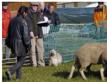
Céline und Amélie: Ganz fixiert auf's Fraule Reif - die wird's schon richten.