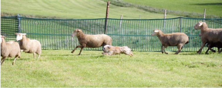
B4 > B5 = Aus dem Treiben heraus Ansatz zum Überholen der fliehenden Herde: Oben mit Céline des Champs des Alouettes (leider nicht bis zum Stoppen (= B5) vollendet) und Mitte mit Harkonnen de la Finaud Gardienne, der die Sequenz bis zum ansatzweise Umkreisen (= B7) ausführte.