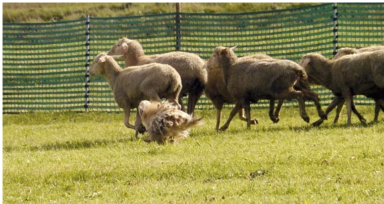
B4 > B5 = Ansatz zum Stoppen der Herde (leider nicht vollendet): Céline des Champs des Alouettes.