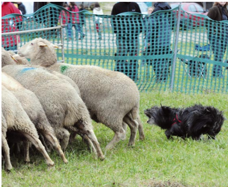
B6 = Andeutung des Griffs (wurde auch vollendet): Harkonnen de la Finaud Gardienne.

Annäherung (oben) an die oder gar in die Schafgruppe hinein (B3) als Interesse verbucht, aber ist es auch das zivilisierte Interesse eines Hütehundes oder doch nur ein ungezügelt Jagdverhalten? Erst nach einer mehr oder weniger kompletten Hütese-